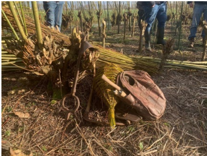
Griendendag 19 februari 2022